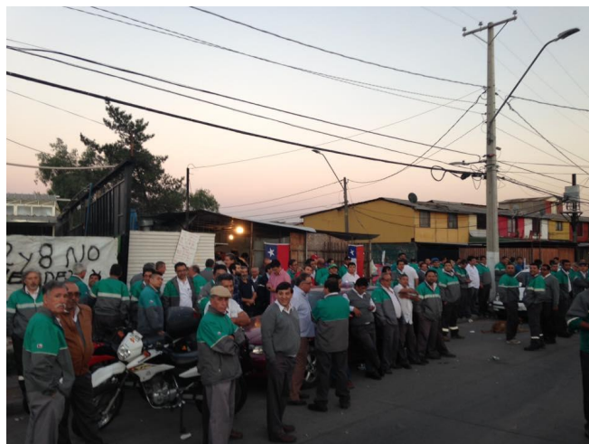
Grupo de trabajadores en huelga de la empresa Vule S.A en enero de 2017

La existencia de más de un sindicato dentro de una misma empresa resta fuerza a los trabajadores en huelga. En primer lugar, al presentarse esta situación, las posturas más radicales -las minoritarias- no tienen un espacio para confrontarse con las más conciliadoras -las mayoritarias- y así emerger una única postura, potencialmente más decidida y confrontacional. Esta situación se ejemplifica en el caso del paralelismo sindical de la empresa de transportes Vule S.A., que en enero de 2017, mes donde se llevó a cabo la huelga de los sindicatos 8 y 42, contaba con la cifra de 12 sindicatos (El Mercurio, 12 de enero de 2017). En segundo lugar, en la misma línea de lo expresado previamente, el paralelismo sindical genera visiones políticas escindidas entre los trabajadores sindicalizados. Para explicar esto, se recurrirá al caso de Vule S.A. nuevamente. Si hay 12 sindicatos en una misma empresa y sólo 2 deciden irse a huelga, con gran probabilidad, alguno de los 10 sindicatos restantes presentan visiones más conciliadoras frente a la patronal. De este modo, se generan sindicatos más conciliadores y otros más radicales (entiéndase dentro de los parámetros de la radicalidad y la conciencia de clase de los trabajadores chilenos en el presente). En resumidas cuentas, el paralelismo fragmenta las fuerzas de la clase trabajadora organizada al momento de enfrentarse con la burguesía.